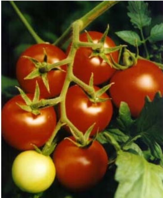
Sonnengereifte Tomaten mit vorzüglichem Geschmack