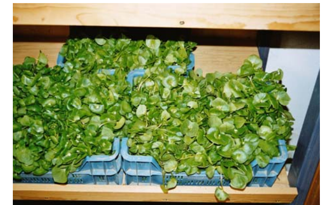
Portulakkisten im Verkaufsregal

Laufend aktuelle Angebote je nach Jahreszeit!