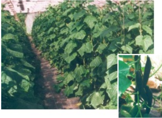
Unsere Produkte zeugen von Qualität und Frische!